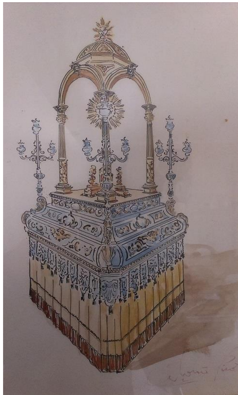
Anda de la Procesión del Corpus Christi. Orfebre: Sr. Picó. 1975