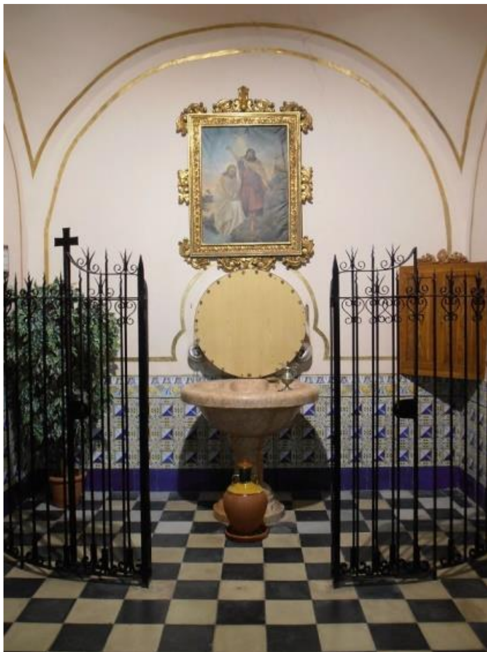
Bautismo del Señor. Meseguer. 1941