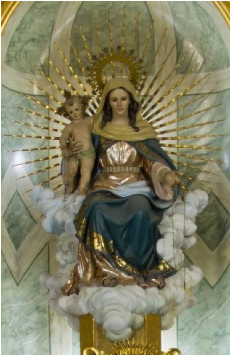
Inocencio Cuesta López. 1950