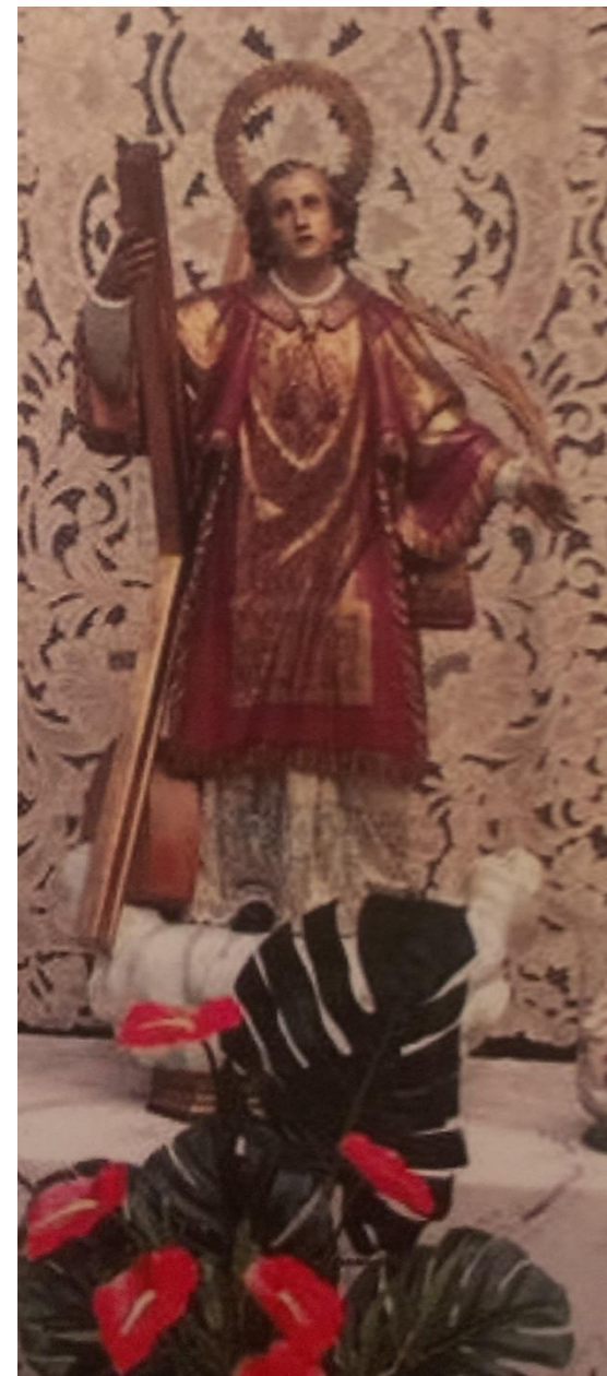
Imagen procesional de la Fiesta de San Vicente Mártir de Benimámet. Custodiada por el clavario mayor durante el año.