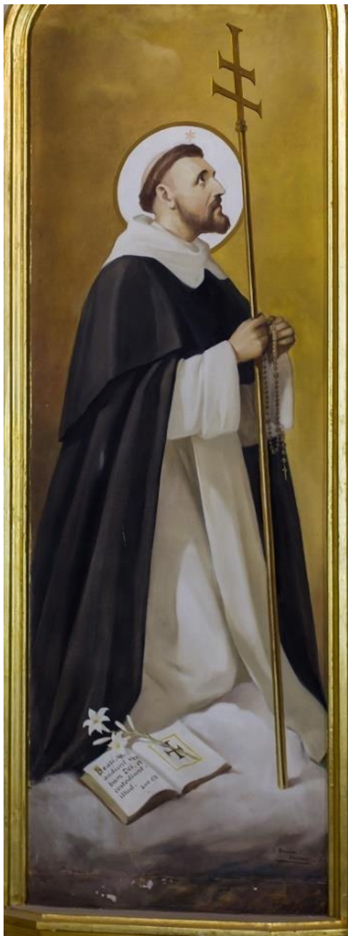
José Bellver Delmás.

Santo Domingo de Guzmán O.P. (Caleruega, Burgos en 1170 – Bolonia, 6 de agosto de 1221)