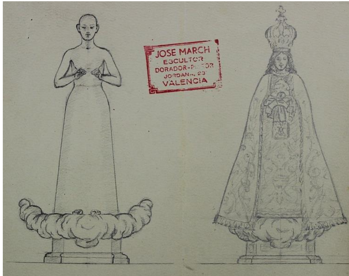
IMAGEN DE NUESTRA SEÑORA DEL CARMEN (Boceto original)