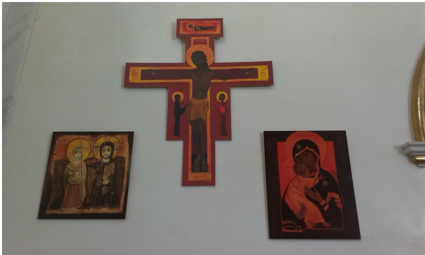
Cristo y Apa Menas Icono copto