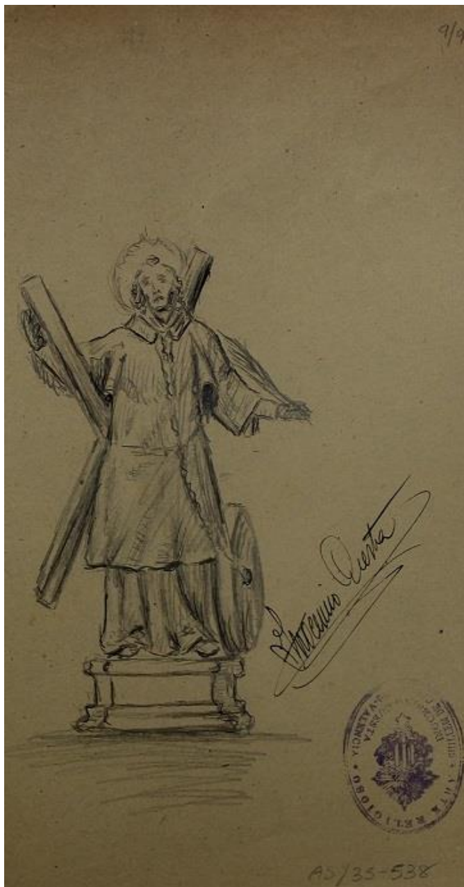
Imagen que se hizo para la procesión