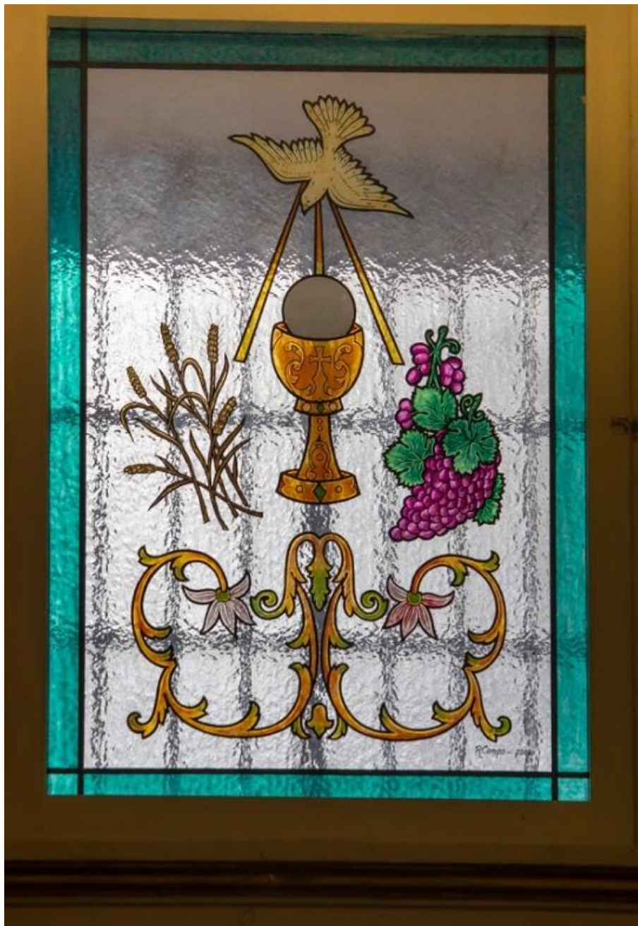
Vidriera eucarística. Rafael Camps Marí, 2004