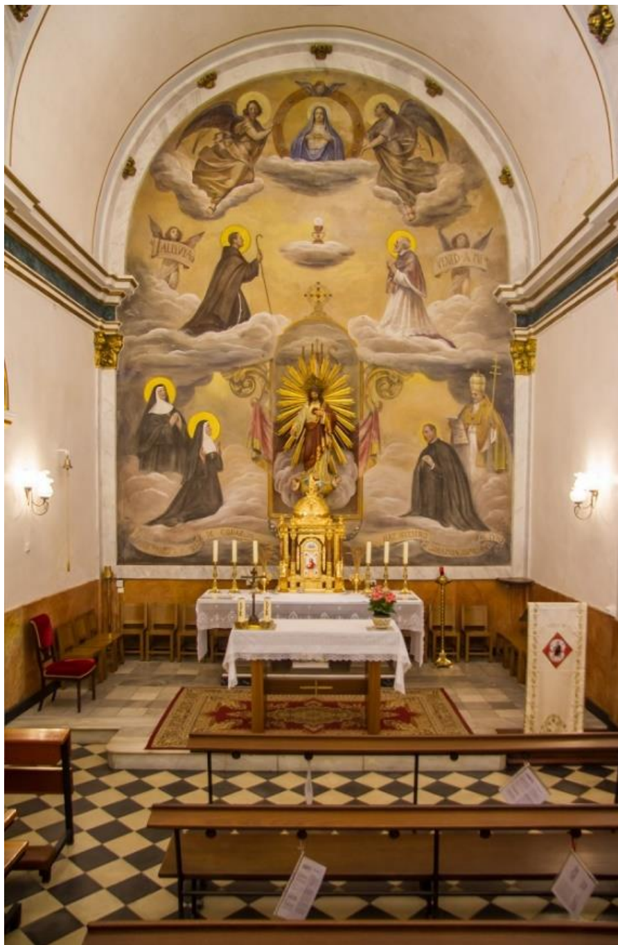
Pintura mural. José Bellver Delmás. 1949