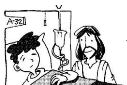
Unción de Enfermos